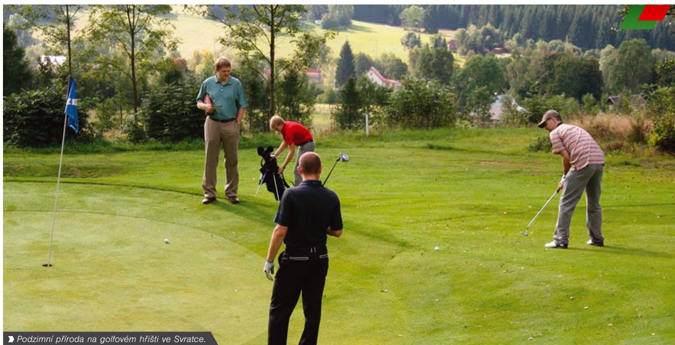
► Podzimní příroda na golfovém hřišti ve Svratce.

Krásné prostředí chráněné krajinné oblasti Žďárské vrchy, slunečné babí léto a blízkost golfového hřiště – v pořadí již sedmý Zákaznický den společnosti K-net měl ideální podmínky a výbornou atmosféru. Českomoravská vysočina láká k návštěvě čistou přírodou a optimální polohou ve středu České republiky. Místem konání Zákaznického dne byl nově zrekonstruovaný Hotel Mánes ve Svratce, který k těmto trumfům přidal ještě příjemný interiér, půvabnou zahradu a výtečnou domácí kuchyni, kam nemají přístup chemické přísady ani polotovary. Za volbu prostředí dostali pořadatelé od všech účastníků velkou pochvalu.