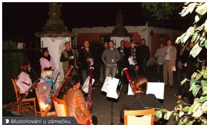
► Muzicírování u zámku.

Lovecký zámek postavil v letech 1770 – 1775 hrabě Filip Kinský, dnes je pro veřejnost uzavřen a teprve čeká na smysluplné využití. Prohlídka se tedy nekonala, ale místo ní čekalo před zámeckými branami na účastníky Zákaznického dne milé překvapení. Divčí fagotový kvartet Prima tesera složený ze studentek JAMU a brněnské konzervatoře namíchal z klasických, jazzových i filmových melodií ideální koktejl pro zářivou noc. Hřejivý zážitek!