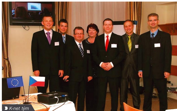
► K-net tým

En In the article "Speakers talked about cloud computing, but the sky above Svratka remained cloudless" 7th K-net Customer's Day is summarized. At Thursday's presentation, which were aimed primarily at managers, followed Friday's workshops for IT professionals. Customer Day was held in the beautiful countryside of the highlands ("Vysočina"), the participants also had time to go for a romantic stroll to the nearby Baroque castle, or to try out Svratka Golf Course.