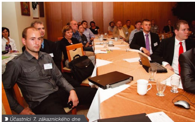
► Účastníci 7. zákaznického dne

Zatímco se IT specialisté podrobně věnovali technickým přednáškám, sportovci vyrazili užít si přírody, babího léta a především devítijamkového golfového hřiště ve Svratce. Jde o jedno z nejstarších golfových hřišť v České republice, vybudované na přelomu let 1939 a 1940 podle návrhu výtvarníka Aloise Chocholáče na popud slavných českých umělců Jiřího Trnky, Jana Zrzavého a dalších. Golfisté si užili přírodně tvarované členité dráhy, nehráči se seznámili se základem golfu nejenom na cvičném odpališti a všichni si užili příjemné dopoledne.