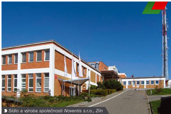
► Sídlo a výroba společnosti Noventis s.r.o., Zlín

Společnost K-net projekt řídí nejen po technologické, ale také po administrativní stránce, která souvisí především s finanční spoluúčastí EU. Na této zakázce prokazuje své schopnosti administrátora a integrátora rozsáhlých projektů, které vyžadují řízení většího počtu subdodavatelů.