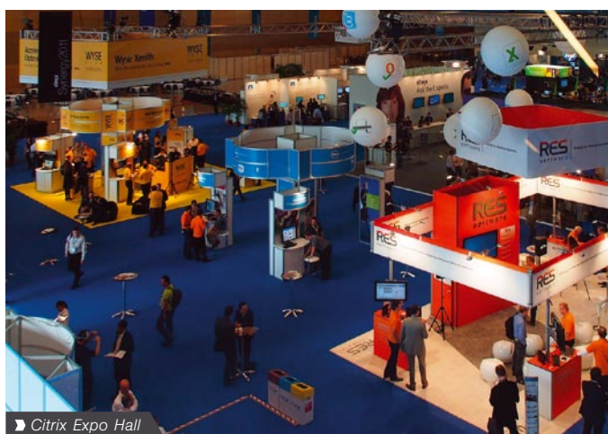
► Citrix Expo Hall